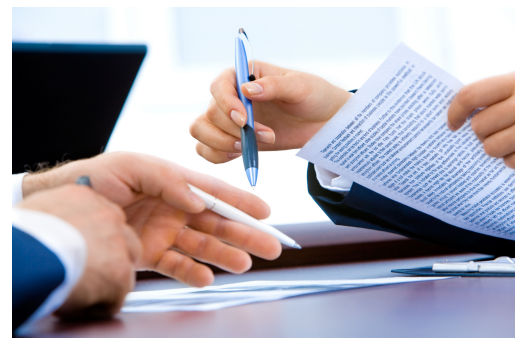
CONTRAT ELISE Annexe 3 (Page 28)