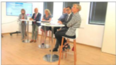
La charte, signée mardi, est destinée à encourager l'implication des entreprises en faveur des quartiers défavorisés.

UNE VINGTAINÉ D'ACTEURS DU MONDE ÉCONOMIQUE A SIGNÉ, CE MARDI LA CHARTE « ENTREPRISES ET QUARTIERS », LAQUELLE VA LEUR PERMETTRE DE VALORISER LEURS ENGAGEMENTS AU CÔTÉ DES DIFFÉRENTS PARTENAIRES ÉVOLUANT DANS LE CHAMP DE L'INSERTION DES PUBLICS ÉLOIGNÉS DE L'EMPLOI ET DE LA LUTTE CONTRE LES INÉGALITÉS.